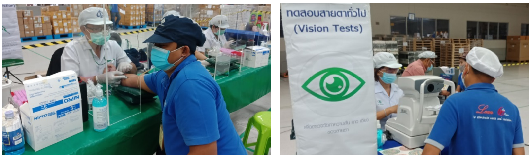
การตรวจสุขภาพทั่วไป ปีจัดเสี่ยงประจำปีของพนักงานต่อเนื่องทุกปี