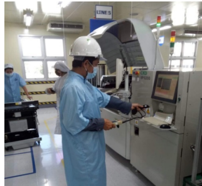
การตรวจวิเคราะห์คุณภาพด้านสิ่งแวดล้อมในสถานประกอบการ