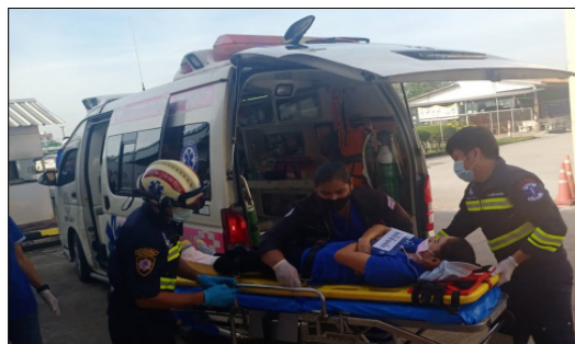
การจัดฝึกอบรมปฐมพยาบาลและปฏิบัติการช่วยชีวิตขั้นพื้นฐาน