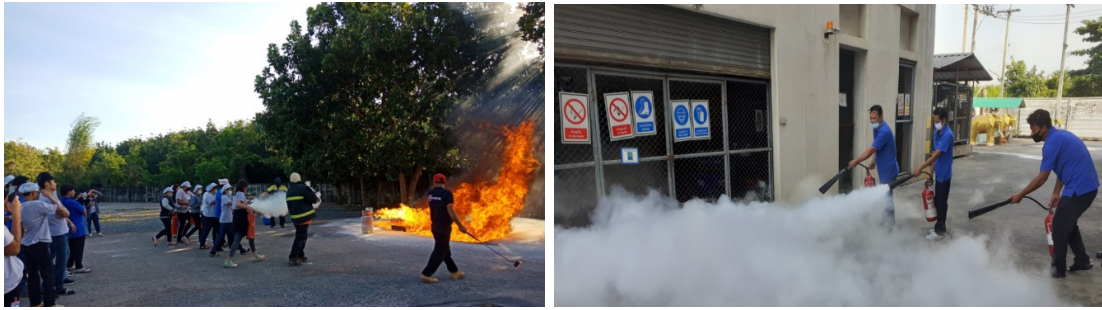
การฝึกอบรมดับเพลิงขั้นต้นและการฝึกซ้อมดับเพลิง

ด้านการร้องเรียน เปิดโอกาสให้มีการร้องเรียนของพนักงานต่อบริษัท ในเรื่องที่ไม่ได้รับความเป็นธรรม มีการปฏิบัติที่ไม่ถูกต้อง หรือมีการละเลยไม่ปฏิบัติตามข้อบังคับการทำงานหรือสัญญาหรือข้อตกลงที่ร่วมกันจัดทำไว้ โดยมีการกำหนดเป็นแนวทางให้ผู้ร้องทุกข์ได้ปฏิบัติตามขั้นตอน หรือกระบวนการร้องทุกข์ที่บริษัท กำหนดไว้ในข้อบังคับเกี่ยวกับการทำงานของบริษัท